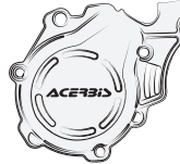
B - (1 PCS)